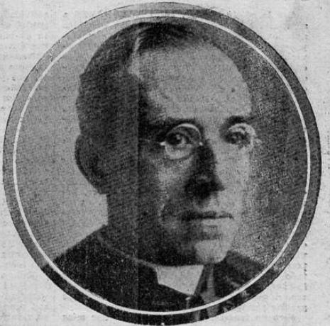
ELECTO EL NUEVO PAPA

"LA TRIBUNA" FUE EL PRIMER PERIODICO QUE ANUNCIO LA ELECCION, GRACIAS AL SERVICIO CABLEGRAFICO DE LA "UNITED PRESS"